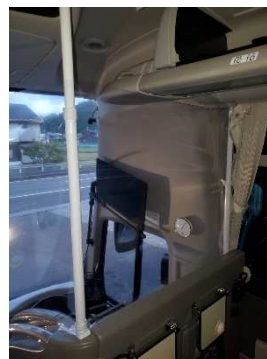
【3. 運転席との仕切り設置】