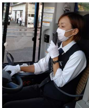
【5. 運転・アナウンス時のマスク着用】