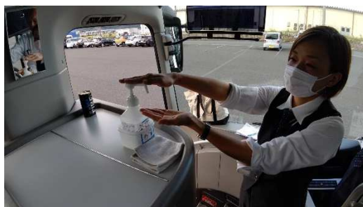
【6. 利用者乗降支援後の手指消毒】