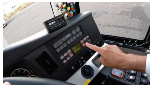
【7. 走行中の外気導入モード作動】