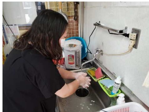
【2. マスク着用、手洗い励行の実施】